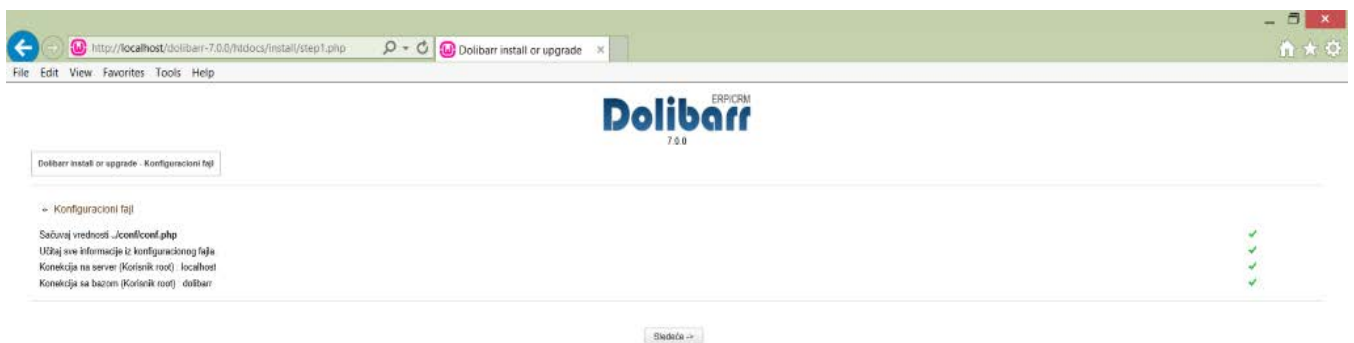
Slika 2. Ekran sa sumiranim osnovnim instalacionim podacima

U koliko ne postoji Dolibar baza podataka treba je kreirati, ako postoji treba osloboditi polje Create Database. Podešavanja kominkacije sa bazom podataka su identična podešavanjima u PHPMyadmin-u. Ako baza podataka već postoji prikazaće se ekran kao na slici 2.