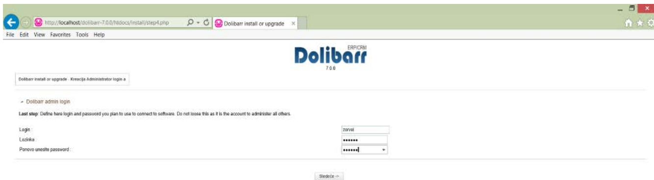
Slika 3. Ekran za kreiranje pristupnih podataka