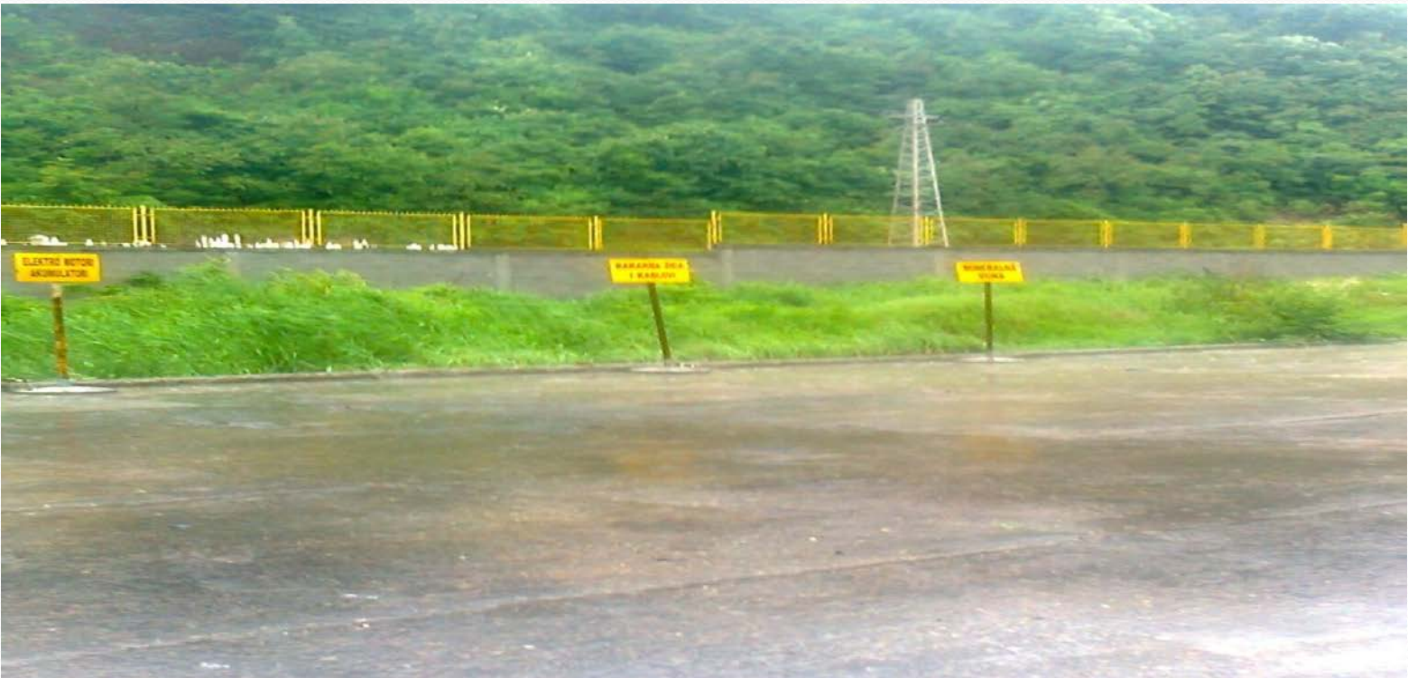
Depo za privremeno odlaganje sekundarnih sirovina

Otpad se skladišti na mestima koja su tehnički opremljena za privremeno čuvanje otpada na lokaciji proizvođača ili vlasnika otpada. Skladištenje otpada vrši se na način koji minimalno utiče na zdravlje ljudi i životnu sredinu. Skladište otpada koji se koristi kao sekundarna sirovina može biti otvorenog ili zatvorenog tipa, ograđeno i pod stalnim nadzorom. U fabrici cementa pravi se razlika između interno nastalog otpada i eksterno isporučivanog otpada koji se koristi kao alternativna sirovina i kao alternativno gorivo.