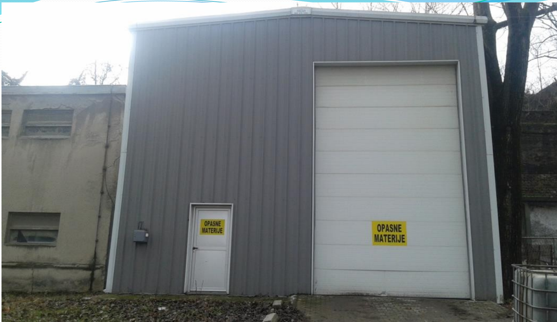
Hala za skladištenje opasnih materija